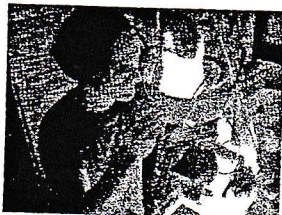
...um einzeln abfotografiert und animiert zu werden.

Schon im Vorjahr wurde Virgil Widrichs Kurzfilm Copy Shop für einen Oscar nominiert. Sein neuer innovativer Kurztrickfilm Fast Film wurde zum Wettbewerb um die Kurzfilm-Palme nach Cannes eingeladen. Celluloid sprach mit dem Salzburger über seine 15-minütige Achterbahnfahrt durch die Filmgeschichte, von Grace Kelly bis Sean Connery.