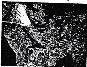
Hintergründe werden gebaut