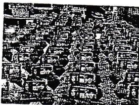
65.000 Papierobjekte stehen bereit...